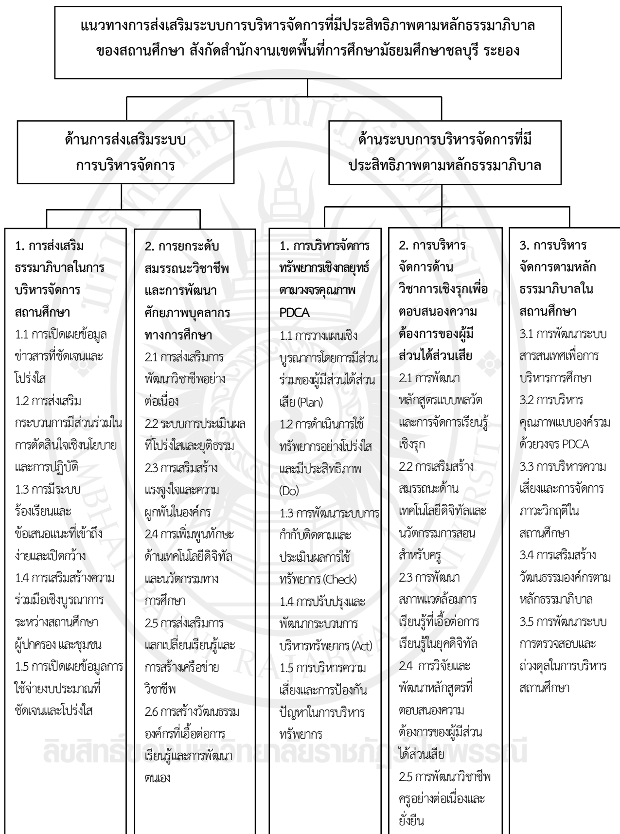
ภาพที่ 4.1 แนวทางการส่งเสริมระบบการบริหารจัดการที่มีประสิทธิภาพตามหลักธรรมาภิบาล ของสถานศึกษา สังกัดสำนักงานเขตพื้นที่การศึกษามัธยมศึกษาชลบุรี ระยอง