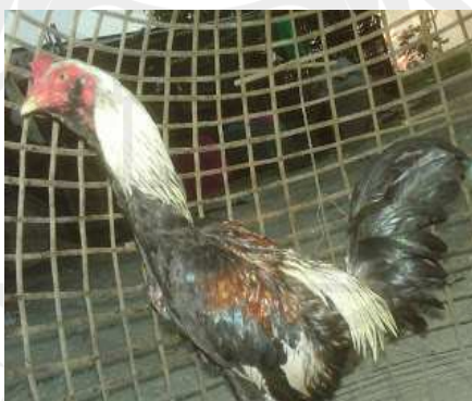
ภาพประกอบ 15 ไก่ชนพม่าพัฒนา (พม่าผสมบราซิล)

สำหรับเซียนไก่ที่ต้องการนำไก่ชนของไทยเข้าชนกับไก่พม่านั้น การอ่านเชิงพม่าให้ขาด เป็นสิ่งจำเป็นอย่างยิ่ง เพราะจะช่วยในการตัดสินใจได้ง่ายขึ้น ในทุกครั้งที่ทำการเปรียบไก่อคู่ต่อสู้ มักจะยอมให้เราจับตัวไก่ได้ และในขณะที่คู่ต่อสู้ผลอนั้น เราสามารถจะทดสอบได้ว่าพม่าตัวนั้นๆ เป็นไก่เชิงอะไร คือหลังจากที่จับตัวไก่จนพอใจแล้ว ให้ปล่อยไก่พม่าขึ้นอย่างสบายๆ โดยให้หันหน้า