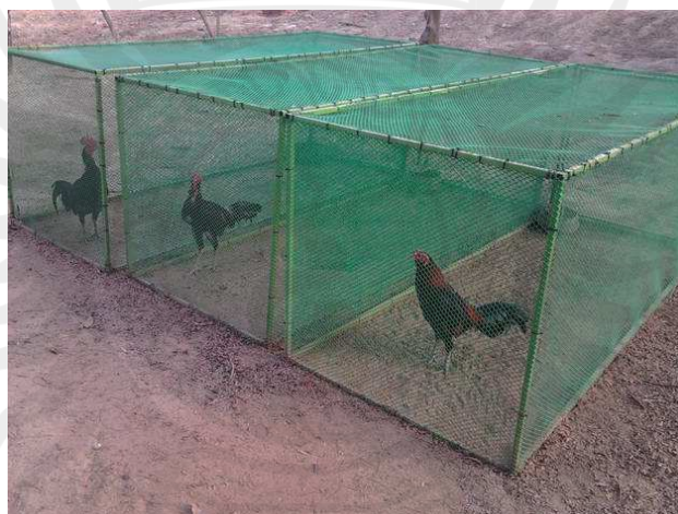
ภาพประกอบ 11 การฝึกวิ่งคู่