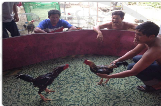
ภาพประกอบ 10 การช้อมไก่ควรถ้อมเดือนละ 2 ครั้ง