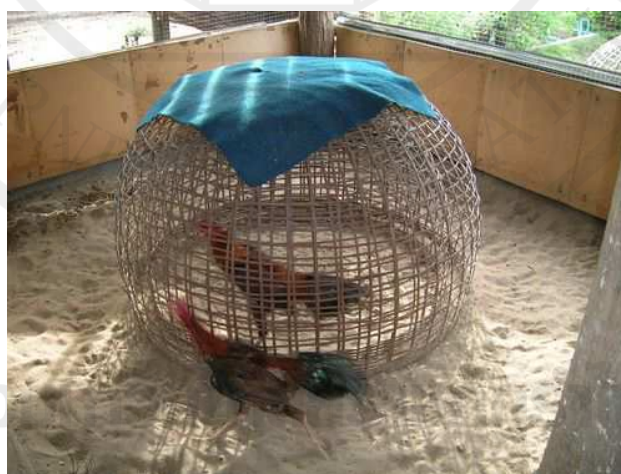
ภาพประกอบ 12 การฝึกเวียนสู่่ม