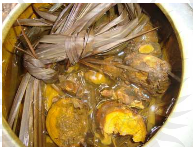
ภาพประกอบ 13 น้ำสมุนไพรที่นำมาต้มเพื่อกราดน้ำไถ่ขน

2.2 เทคนิคการกราดน้ำ และกราดแดดไถ่ขน การเลี้ยงไถ่ขน เรามีไถ่แก่งอย่างเดียวไม่พอ ความสมบูรณ์และแข็งแรงของไถ่ก็เป็นสำคัญอย่างหนึ่ง การกราดน้ำและกราดแดดจึงมีความสำคัญไม่แพ้กันกับการออกกำลังกายหรือการกินอาหารบำรุง ขณะเดียวกันการกราดน้ำและการกราดแดดก็มีโทษเช่นกันเพราะตามวิสัยของไถ่ไม่ชอบกับการกราดน้ำเลยถ้ามีเทคนิคในการกราดน้ำอาจเป็นโทษมากกว่าจะเป็นประโยชน์ ดังนั้นในการกราดน้ำและกราดแดดจึงมีเทคนิคดังนี้ การกราดน้ำไถ่ขน ปกติในการกราดน้ำไถ่ขนจะใช้น้ำได้ 2 วิธีด้วยกันคือน้ำอุ่น (เป็นน้ำยาสมุนไพร) กับน้ำเย็นที่ตักมาจากโอ่งที่เราเก็บไว้ซึ่งมีความแตกต่างกัน คือ