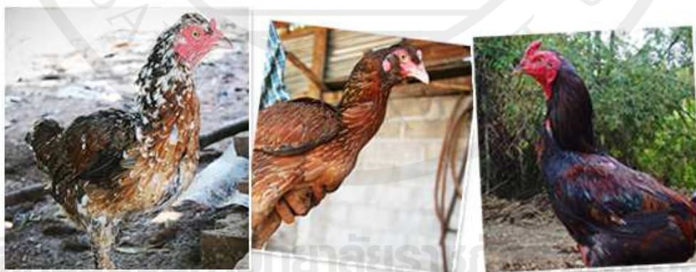
ภาพประกอบ 16 ไก่เหล่าป่าก้อยพัฒนา

การพัฒนาไก่ป่าก้อย ควรเป็นป่าก้อยพัฒนาที่เป็นเหล่าดีแรงดีแม่นไว้พัฒนาเป็นเลือดสูงหรือพัฒนาข้ามกับไก่ไทยสายเลือดอื่น แม้บางท่านจะไม่ชอบแต่ก็ควรจะมีไว้เพื่อศึกษา ที่สำคัญป่าก้อยทุกวันนี้ก็พัฒนาไปไกลมากจนยากจะตามทัน เช่น ป่าก้อยผสมพม่า เป็นไก่รอยเล็กที่ป่าดีดีแม่นก็น่าเล่นสำหรับท่านที่ชอบรอยเล็ก ป่าก้อยผสมพม่าผสมไทยตราดหรือ พันธุ์สงอน เน้นก้อยเยอะเกิน 50% แบบนี้ก็น่าเล่นเพราะเร็วแม่นคมหนักมาก ท่านที่ชอบพม่าก็อย่าลืมลึงนี้มองข้ามไม่ได้ ไก่เหล่าป่าก้อยที่จะนำมาพัฒนาในอนาคต ควรจะมีอะไรบ้าง ไม่ว่าจะเป็นก้อยร้อย หรือ ก้อยลูกผสม จะต้องเป็นไก่ไม่ไล่หัว กัดตีทุกที ดีแรงควร จะพัฒนาเรื่องรูปร่าง โครงสร้าง เบอร์แข้งที่โหด รับรองชนได้ทุกเชิงเพราะป่าก้อยร้อยจะมีรูปร่างเล็ก ที่สำคัญต้องพัฒนาดีด้วย อย่าให้คู่ต่อสู้จับทางได้ จงจำไว้ว่าถ้าไก่พม่าเข้ามาเปรียบกับเรา โดยที่คู่ลักษณะเราออก นั้นแสดงว่าถ้าไม่แน่นจริงเขาไม่กล้าสู้เราหรือไก่ป่าก้อยยุคใหม่ ควรจะมีแข้งหน้ามา เพื่อที่จะทำลายจิ้งหะคู่ต่อสู้ ก่อนทำเชิง และบังคับให้คู่ต่อสู้เข้าทางเราให้ได้