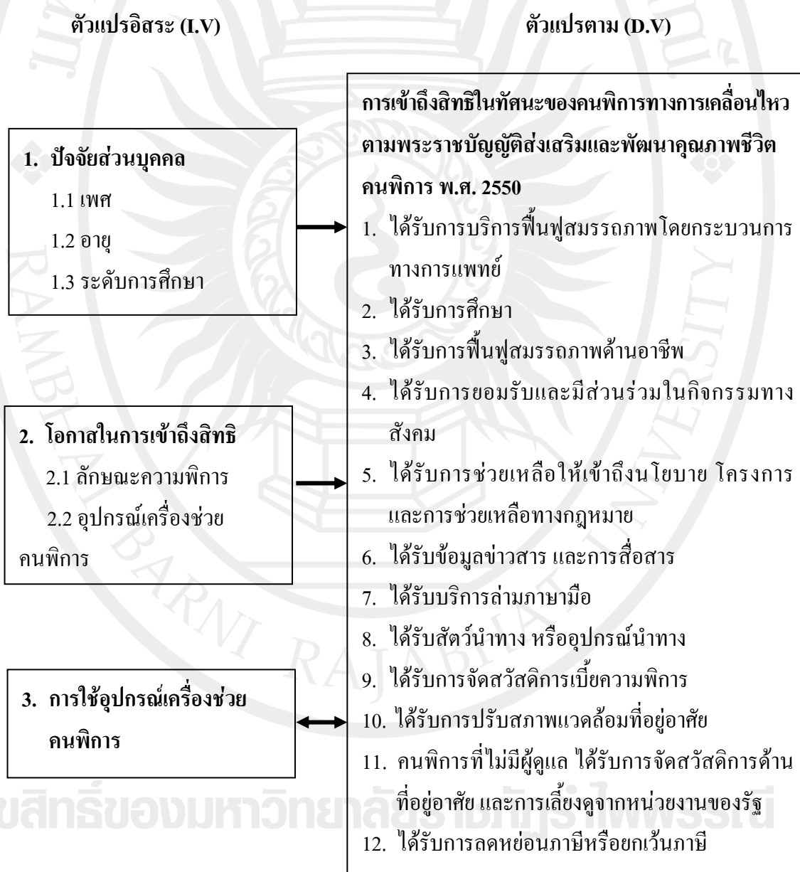
ภาพประกอบ 2 กรอบแนวคิดในการวิจัย

การศึกษาวิจัยครั้งนี้ ผู้วิจัยมุ่งที่จะศึกษาการเข้าถึงสิทธิในทักษะของคนพิการทางการ เคลื่อนไหวในอำเภอเมือง จังหวัดจันทบุรี ตามพระราชบัญญัติส่งเสริมและพัฒนาคุณภาพชีวิต คนพิการ พ.ศ. 2550 ซึ่งมีกรอบแนวคิดในการวิจัย ดังนี้