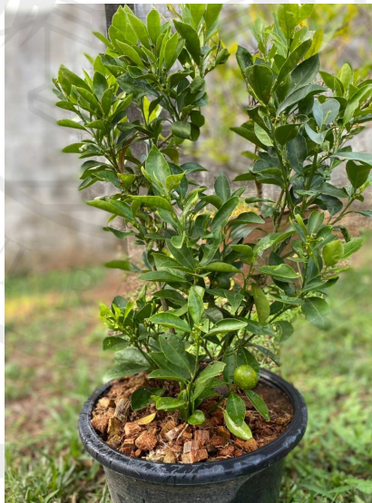
ภาพประกอบ 1 ต้นส้มจี๊ด

1. ต้น เป็นไม้พุ่มขนาดกลาง เมื่อมีอายุ 4 - 5 ปีขึ้นไป จะมีความสูงจากพื้นดินถึงยอดอยู่ระหว่าง 1.25 - 2.70 เมตร มีเส้นรอบวงระหว่างลำต้น 12.00 - 16.00 เซนติเมตร มีความกว้างของรัศมีทรงพุ่ม 1.30 - 1.65 เมตร เมื่ออายุยังน้อยเปลือกของลำต้นจะมีสีน้ำตาลอ่อน และเมื่อมีอายุมากขึ้น เปลือกจะเปลี่ยนเป็นสีน้ำตาลเข้ม กิ่งอ่อนของส้มจี๊ดจะมีหนามแหลมคม (สำเริง ช่างประเสริฐ และกมลภัทร ศิริพงษ์. 2558 : 4)