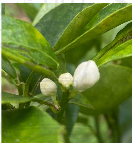
ภาพประกอบ 3 ดอกส้มจี๊ด

โดยสำหรับราคาขายช่วงฤดูฝน จะมีราคาอยู่ที่กิโลกรัมละ 5 - 10 บาท ช่วงที่ขาดแคลน จะมีราคาอยู่ที่กิโลกรัมละ 30 - 35 บาท