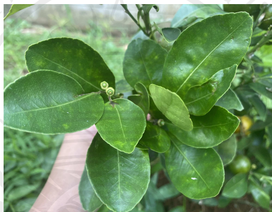
ภาพประกอบ 2 ใบส้มจี๊ด

2. ใบ ใบของส้มจี๊ดจะเป็นรูปไข่ โคนใบมน ขอบใบเรียบ ปลายใบแหลม มีการเรียงตัวของใบเป็นแบบสลับ ใบมีขนาดความยาว 4.00 - 7.00 เซนติเมตร ยาว 2.00 - 4.00 เซนติเมตร ใบจะมีสีเขียวอ่อน เมื่ออายุมากขึ้นใบจะมีสีเขียวเข้ม ผิวใบเป็นมัน (สำเริง ช่างประเสริฐ และกมลภัทร ศิริพงษ์. 2558 : 4)