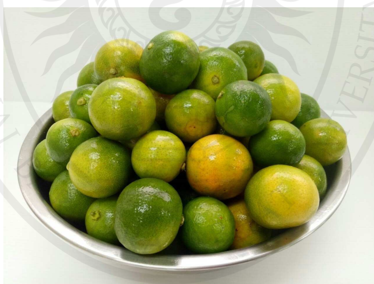
ภาพประกอบ 4 ผลส้มจี๊ด