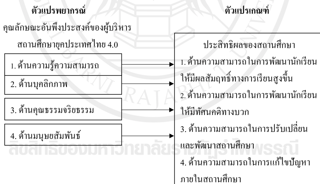
ภาพประกอบ 1 กรอบแนวคิดในการวิจัย

ในการวิจัยครั้งนี้เป็นการศึกษาคุณลักษณะอันพึงประสงค์ของผู้บริหารสถานศึกษาในยุคประเทศไทย 4.0 โดยการสังเคราะห์ตัวแปรจากแนวคิดของ เต็มสิริ ทิพย์จันทา (2553 : 139), พิมพ์ฐิตา วัจนวงศ์ปัญญา (2555 : 10), เอกสิงห์ ปากแก้ว (ออนไลน์. 2558) , พัทธสิญ นวโลจิตรรัตน์ และคณะ (2560 : 47), บวร เทศารินทร์ (ออนไลน์. 2560), สุบัน พรเวียง (2562 : 329), นที กอบการนา และคณะ (2562 : 47), สต็อกคิลล์ (Stogdill. 1974 : 75-76), ยุกต์ (Yukl. 1998 : 132), ฮอยและมิสเกล (Hoy & Miskel. 2001 : 51) และสรุปตัวแปรได้ดังนี้ 1) ด้านความรู้ความสามารถ 2) ด้านบุคลิกภาพ 3) ด้านคุณธรรมจริยธรรม และ 4) ด้านมนุษยสัมพันธ์ ศึกษาประสิทธิผลของสถานศึกษาโดยการสังเคราะห์ ตัวแปรจากแนวคิดของ ภารดี อนันต์นาวี (2551 : 216), ประเทืองทิพย์ สุขุมลจินทร์ (2557: 7), อนงค์ อาจจงทอง (2559 : 41), อรพรรณ ตูจันดา (2558 : 47), นฤมล เจริญพรสกุล และคณะ (2559 : 114), จตุรภัทร ประทุม และคณะ (2559 : 120), มอทท์ (Mott. 1972 : 305), เครียดเนอร์ และคินิกิ (Kreitner & Kinicki. 2007 : 153), ฮอย และมิสเกล (Hoy & Miskel. 2001 : 51) และสรุปตัวแปรได้ดังนี้ 1) ด้านความสามารถในการพัฒนานักเรียนให้มีผลสัมฤทธิ์ทางการเรียนสูงขึ้น 2) ด้านความสามารถในการพัฒนานักเรียนให้มีทัศนคติทางบวก 3) ด้านความสามารถในการปรับเปลี่ยนและพัฒนาสถานศึกษา และ 4) ด้านความสามารถในการแก้ไขปัญหาภายในสถานศึกษา สรุปเป็นกรอบแนวคิดในการวิจัยได้ดังนี้