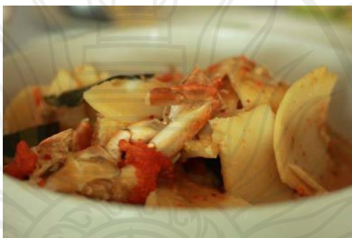
ภาพประกอบ 10 แกงกะทิหน่อไม้กับปู

ส่วนแกงกะทิหน่อไม้กับปู ที่ได้รับความนิยมอยู่ในอันดับท้ายด้วยนั้น มาจากปัจจุบันไม่ค่อยมีร้านอาหารนิยมทำ เนื่องจาก ร้านอาหารในปัจจุบันประยุกต์เปลี่ยนจากเนื้อปูที่ทำยากใช้เวลานาน และต้นทุนสูง มาเป็นเนื้อไก่หรือเนื้อหมูมากกว่า ที่จะนิยมแกงกะทิหน่อไม้กับปู ดังคำกล่าวที่ว่า “แพง ต้นทุนสูง” (ลำไย สารเทศ. สัมภาษณ์. 2559)