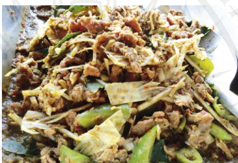
ภาพประกอบ 8 แกงเนื้อหน่อสับประรด

จากการศึกษาข้อมูลในเชิงคุณภาพ โดยยกเอากรณีที่คนจังหวัดจันทบุรีมีความนิยมในการบริโภคแกงเนื้อหน่อสับประรด ซึ่งเป็นความนิยมที่อยู่ลำดับ 18 ผลการศึกษาครั้งนี้มีข้อค้นพบว่าที่ประชาชนในจังหวัดจันทบุรีให้ความนิยมในการบริโภคแกงเนื้อหน่อสับประรดเป็นอันดับสุดท้ายเนื่องจาก ประชาชนในจังหวัดจันทบุรีส่วนใหญ่ไม่ยอมรับประทานเนื้อวัว เพราะบางท่านมีความเชื่อเกี่ยวกับการนับถือเจ้าแม่กวนอิม ไม่รับประทานสัตว์ใหญ่ ทำให้ส่งผลถึงการบริโภคแกงเนื้อหน่อสับประรดที่ลดลงมาด้วย ดังคำกล่าวที่ว่า “คนไม่ชอบกินเนื้อ” (ลำไย สารเทศ. สัมภาษณ์. 2559)