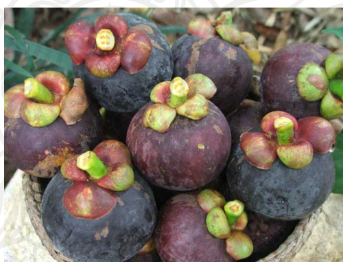
ภาพประกอบ 3 มังคุด

ส่วนผลไม้ที่รองลงมาจากเงาะคือมังคุด เนื่องจากมังคุดเป็นผลไม้ที่มีผลดีต่อสุขภาพช่วยป้องกันโรค เพราะมังคุดเป็นผลไม้ที่มีฤทธิ์เย็น ทำให้ประชาชนในจังหวัดจันทบุรีให้ความนิยมบริโภค มังคุด ดังคำกล่าวที่ว่า “มังคุดมีฤทธิ์เย็น หากินง่าย” (ลำไย สารเทศ. สัมภาษณ์. 2559)