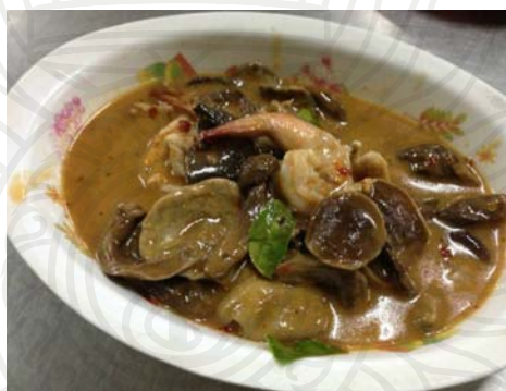
ภาพประกอบ 9 แกงเห็ดเสมีด

ส่วนแกงเห็ดเสมีดที่เป็นอาหารขึ้นชื่อของจังหวัดจันทบุรี แต่ได้รับความนิยมอยู่ในลำดับท้าย เช่นเดียวกับแกงเนื้อหน่อสับประรดนั้น เป็นเพราะสาเหตุที่ว่าเห็ดเสมีดจะเกิดขึ้นตามฤดูกาล และมีรสชาติขม ทำให้แกงเห็ดเสมีดเป็นที่นิยมในคนหนุ่มน้อย ดังคำกล่าวที่ว่า “ขม อร่อย หากินยากมีเป็นหน้าๆ” (ลำไย สารเกษตร. สัมภาษณ์. 2559)