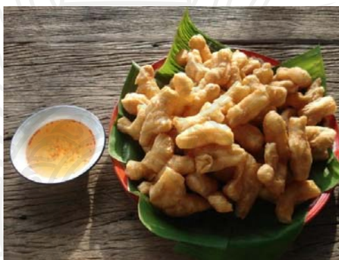
ภาพประกอบ 7 ปาท่องโก๋น้ำจิ้ม

นอกจากนี้แล้วผลการศึกษาในเชิงคุณภาพ ในประเด็นที่คนจังหวัดจันทบุรีให้ความนิยมในการเลือกบริโภคอาหารหวานประเภทปาท่องโก๋น้ำจิ้ม ซึ่งผลการศึกษาที่มีข้อค้นพบว่า กลุ่มตัวอย่างมีระดับความนิยมอยู่ในลำดับแรก ผลการศึกษาที่ได้รับจากการสัมภาษณ์เจาะลึกมีข้อค้นพบว่า ปาท่องโก๋น้ำจิ้ม มีแห่งเดียวในจังหวัดจันทบุรี และได้รับความนิยมมากของประชาชนในจังหวัดจันทบุรี เพราะประชาชนในจังหวัดจันทบุรีส่วนใหญ่ชอบทานกาแฟ และขนมที่สามารถรับประทานกับกาแฟได้รสชาติดี ก็คือปาท่องโก๋น้ำจิ้ม แต่ในปัจจุบันสามารถประยุกต์ ปาท่องโก๋รับประทานคู่กับน้ำจิ้มสังขยาหรือกาแฟก็ได้ ดังคำกล่าวที่ว่า “มีรสชาติดี สามารถกินคู่กับอะไรก็ได้” (ลำไย สารเทศ. สัมภาษณ์. 2559)