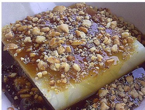
ภาพประกอบ 6 ขนมมันตุง