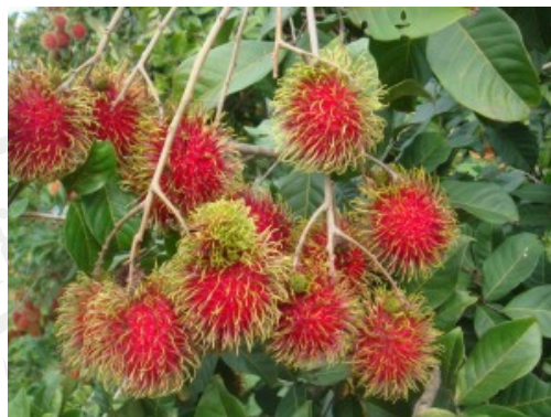
ภาพประกอบ 2 เงาะ

ส่วนผลไม้ที่รองลงมาจากเงาะคือมังคุด เนื่องจากมังคุดเป็นผลไม้ที่มีผลดีต่อสุขภาพช่วยป้องกันโรค เพราะมังคุดเป็นผลไม้ที่มีฤทธิ์เย็น ทำให้ประชาชนในจังหวัดจันทบุรีให้ความนิยมบริโภค มังคุด ดังคำกล่าวที่ว่า “มังคุดมีฤทธิ์เย็น หากินง่าย” (ลำไย สารเทศ. สัมภาษณ์. 2559)