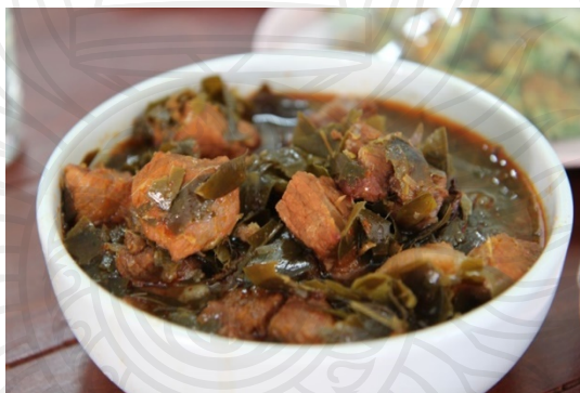
ภาพประกอบ 11 หมูต้มไช้ชะมวง

นอกจากนี้แล้วผลการศึกษาในเชิงคุณภาพ ในประเด็นคนจังหวัดจันทบุรีให้ความนิยมในการเลือกบริโภคอาหารประเภทก๋วยเตี๋ยวหมู/เนื้อเคียง ทั้งที่ความน่าจะเป็นแล้วหากมองจากสังคมภายนอกน่าจะเป็นการเลือกบริโภคหมูต้มชะมวงมากกว่า ทั้งนี้โดยการพิจารณาจากความมีชื่อเสียงของประเภทอาหาร ผลการศึกษาที่ได้รับจากการสัมภาษณ์เจาะลึกมีข้อค้นพบว่า ที่ประชาชนในจังหวัดจันทบุรีส่วนใหญ่ให้ความนิยมบริโภคหมูต้มชะมวงน้อยกว่าก๋วยเตี๋ยวหมู/เนื้อเคียง เพราะคนจันทบุรีส่วนใหญ่ที่ให้ความนิยมบริโภคหมูต้มชะมวงอยู่นั้นมีอายุอยู่ในระดับกลางคน ที่ต้องดูแลสุขภาพมากเป็นพิเศษ เนื่องจากการทำหมูต้มชะมวงนั้นใช้วัตถุดิบที่เป็นหมูสามชั้น ที่อาจจะส่งผลต่อสุขภาพ ทำให้ประชาชนในจังหวัดจันทบุรีให้ความนิยมบริโภคหมูต้มชะมวงน้อยลงมากกว่าสมัยก่อน แต่หมูต้มชะมวงที่เป็นอาหารประจำจังหวัดของจังหวัดจันทบุรียังเป็นที่นิยมอยู่มากของคนต่างจังหวัด