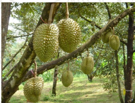
ภาพประกอบ 5 ทุเรียน

ผลการศึกษาในเชิงคุณภาพ ในประเด็นที่คนจังหวัดจันทบุรีให้ความนิยมในการเลือกบริโภคผลไม้ประเภททุเรียนเป็นอันดับ 5 ทั้งที่ความน่าจะเป็นแล้วหากมองจากสังคมภายนอกจะเป็นการเลือกบริโภคทุเรียนเป็นอันดับ 1 ทั้งนี้โดยการพิจารณาจากความมีชื่อเสียงของประเภทผลไม้ไม่ว่าอย่างไรก็ตาม ผลการศึกษาที่ได้รับจากการสัมภาษณ์เจาะลึกมีข้อค้นพบว่า ที่ประชาชนในจังหวัดจันทบุรีให้ความนิยมในการบริโภคทุเรียนเป็นอันดับ 5 เพราะประชาชนในยุคปัจจุบันหันมาดูแลสุขภาพมากขึ้น เนื่องจากทุเรียนมีรสชาติหวานมันและส่งผลเสียต่อสุขภาพของประชาชนวัยกลางคน ทำให้ประชาชนนิยมบริโภคทุเรียนน้อยลงกว่าในอดีต