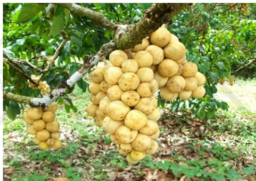
ภาพประกอบ 4 ลองกอง

ผลการศึกษาในเชิงคุณภาพ ในประเด็นที่คนจังหวัดจันทบุรีให้ความนิยมในการเลือกบริโภคผลไม้ประเภททุเรียนเป็นอันดับ 5 ทั้งที่ความน่าจะเป็นแล้วหากมองจากสังคมภายนอกจะเป็นการเลือกบริโภคทุเรียนเป็นอันดับ 1 ทั้งนี้โดยการพิจารณาจากความมีชื่อเสียงของประเภทผลไม้ไม่ว่าอย่างไรก็ตาม ผลการศึกษาที่ได้รับจากการสัมภาษณ์เจาะลึกมีข้อค้นพบว่า ที่ประชาชนในจังหวัดจันทบุรีให้ความนิยมในการบริโภคทุเรียนเป็นอันดับ 5 เพราะประชาชนในยุคปัจจุบันหันมาดูแลสุขภาพมากขึ้น เนื่องจากทุเรียนมีรสชาติหวานมันและส่งผลเสียต่อสุขภาพของประชาชนวัยกลางคน ทำให้ประชาชนนิยมบริโภคทุเรียนน้อยลงกว่าในอดีต